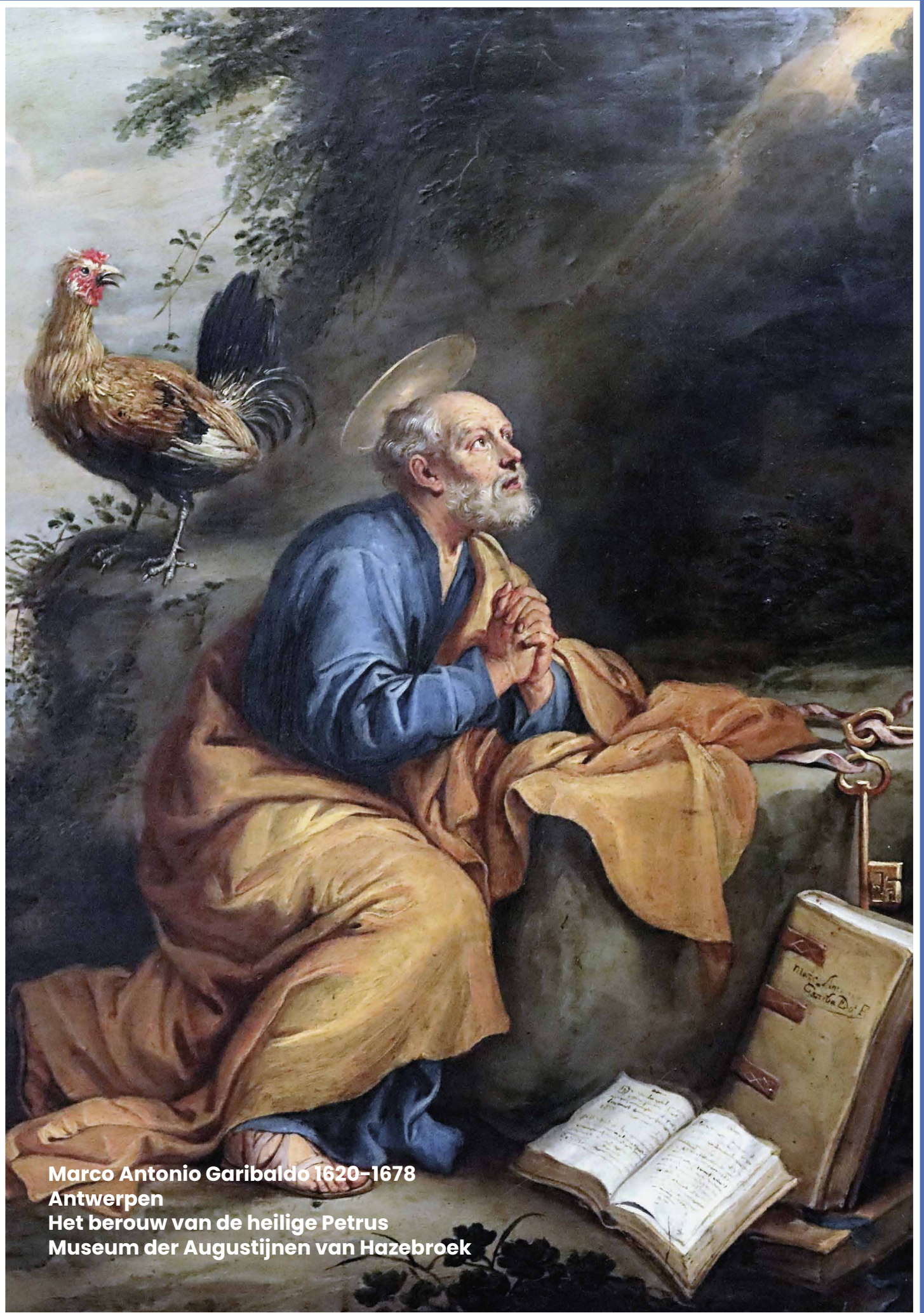
Marco Antonio Garibaldo 1620–1678 Antwerpen Het berouw van de heilige Petrus Museum der Augustijnen van Hazebroek