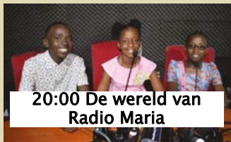
20:00 De wereld van Radio Maria