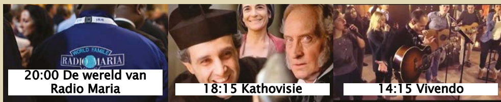
20:00 De wereld van Radio Maria