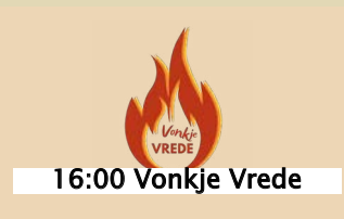
16:00 Vonkje Vrede