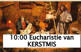
10:00 Eucharistie van KERSTMIS