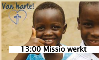
13:00 Missio werkt