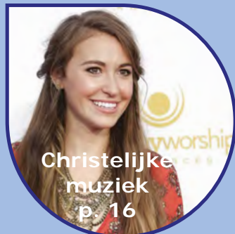
Christelijke muziek p. 16