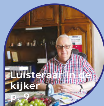
Luisteraar in de kijker p. 9